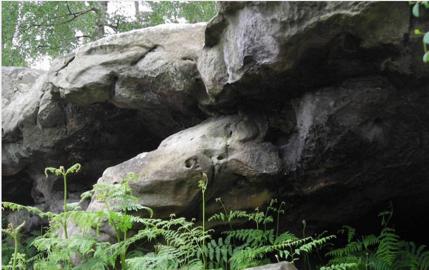
Chaos de grès (PNROPF)