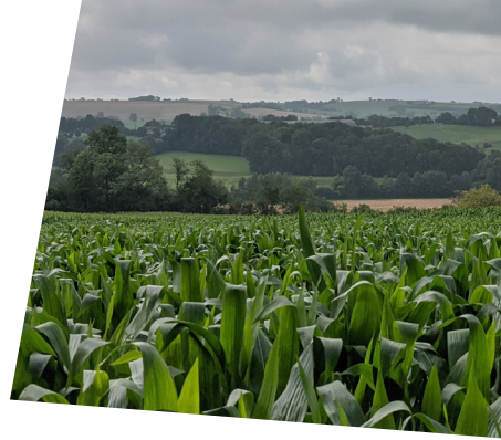
Point de vue sur la commune de Buicourt